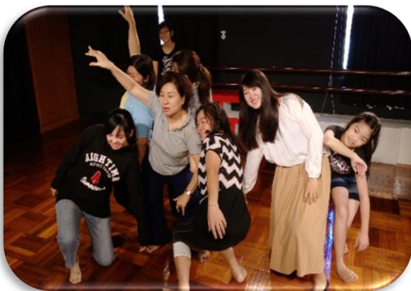
▲ 受邀高雄市毒品防制事務基金會 參與「教育劇場工作坊」