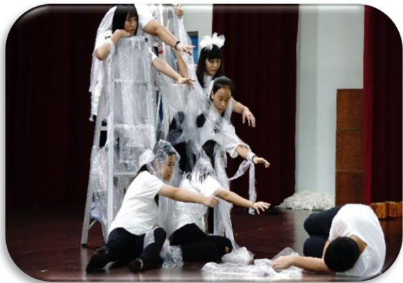
▲ 高雄市立美術館戲劇課