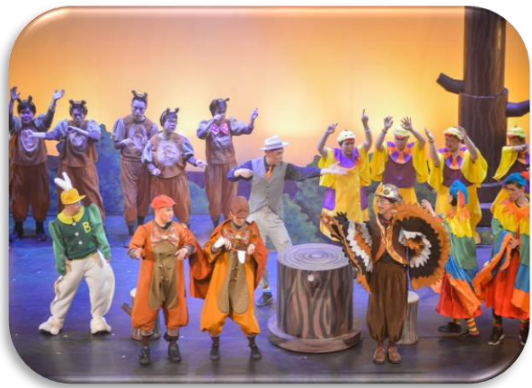
▲ 喜憨兒劇團《我知道我是誰》劇照