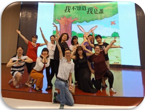
▲ 北京戲劇教育教師研習