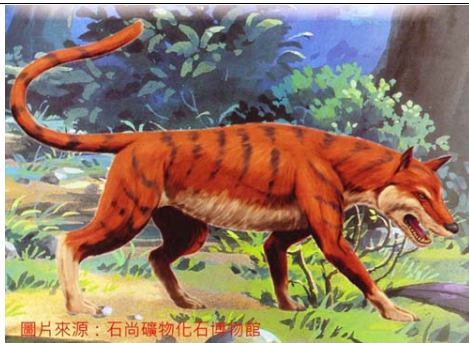
《鯨豚狂想曲學習手冊》第二頁