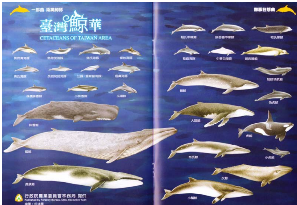
《鯨豚狂想曲學習手冊》第 14-15 頁

【註：《鯨豚狂想曲學習手冊》中知所有圖像及文字，作者本人已於 2013 年 5 月時徵詢過陽明海洋探索館之館長簡明志先生，手冊之內容全數可授權於教學現場進行教學使用。】