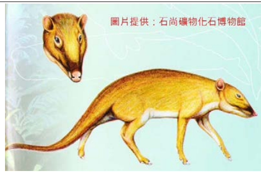
《鯨豚狂想曲學習手冊》第三頁