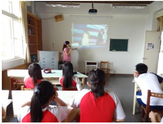
學生欣賞〈人因夢想而偉大〉新聞報導