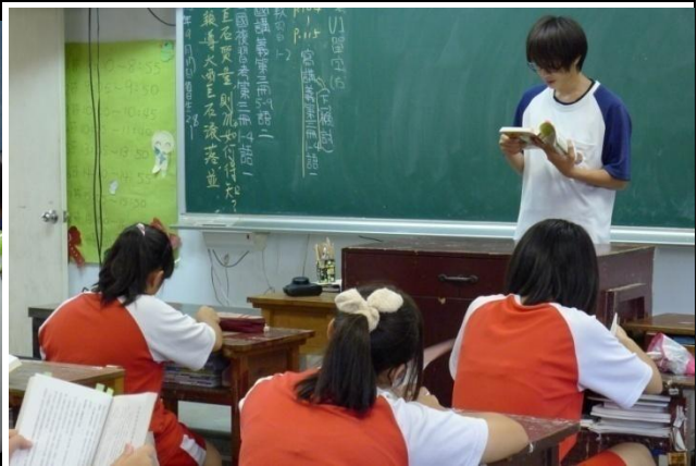
學生進行專書專文任務發表