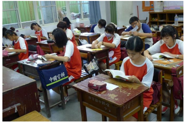
學生閱讀《中學生晨讀 10 分鐘人物故事集》