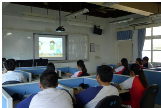
學生觀賞〈奧立佛是個娘娘腔〉繪本