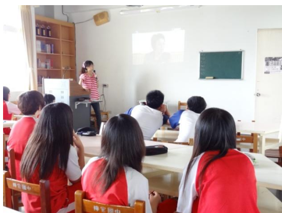
學生觀賞紀錄片〈葉詠鋹事件剪輯〉