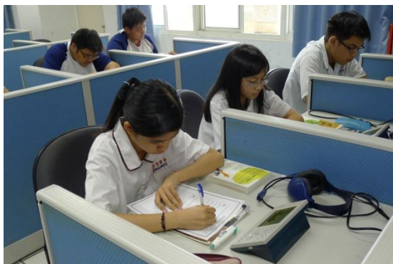
學生書寫學習單〈性別大搜查〉