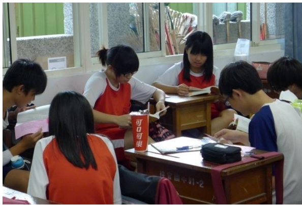
學生進行專書專文分組討論